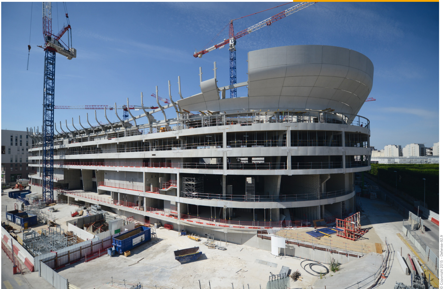
Mise en place de plus de 500 coques de la couronne de béton blanc de l'Arena Nanterre-La Défense.