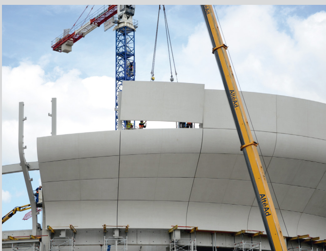
Mise en place des coques en béton blanc, réalisées à partir du ciment i.design ULTRACEM 52,5 N SB de Ciments Calcia, sur la couronne de l'Arena Nanterre-La Défense.